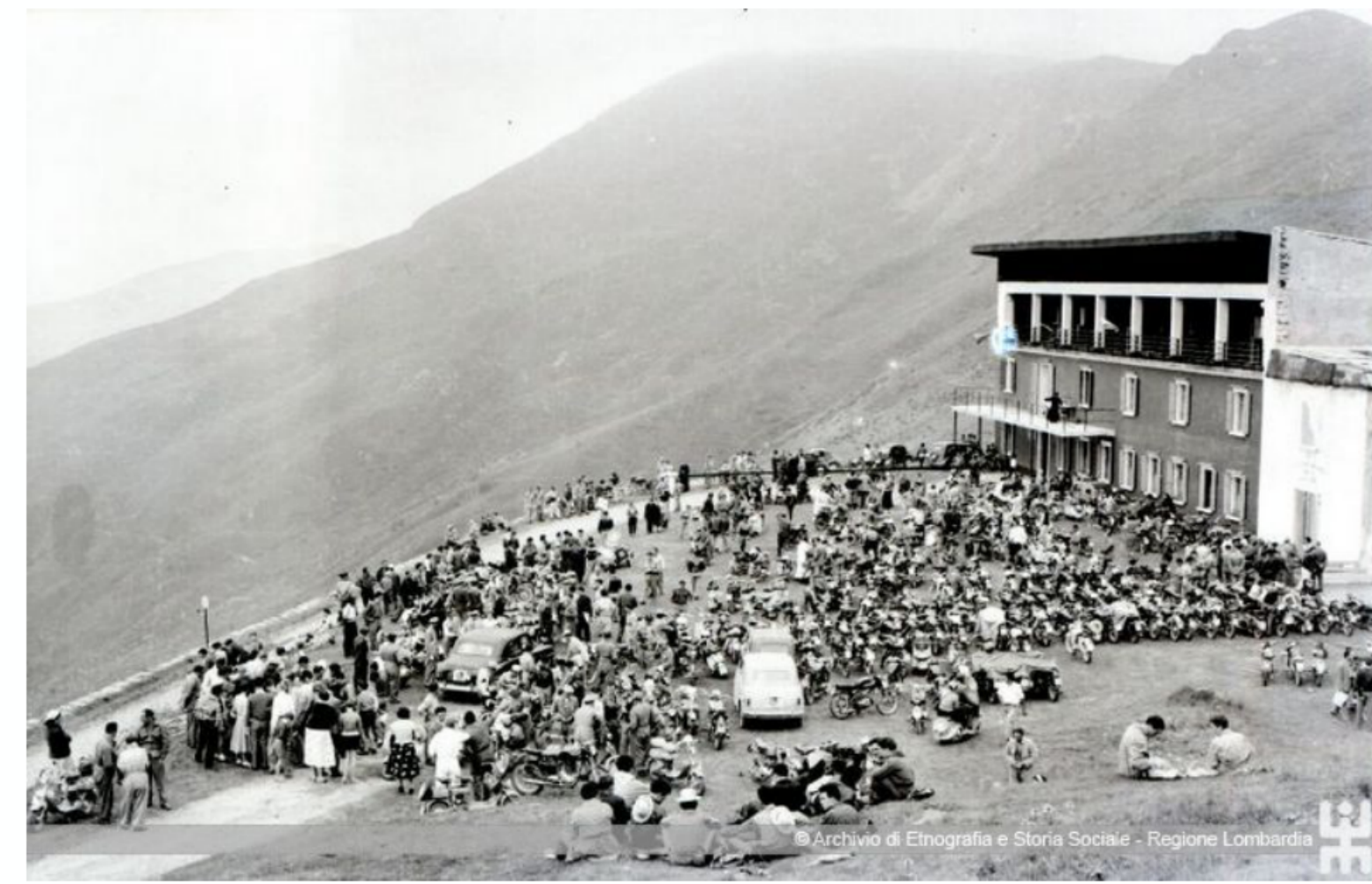
Motoraduno al rifugio Bonardi in Maniva