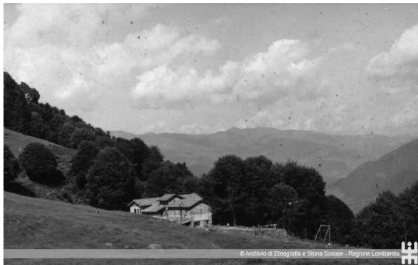
Il rifugio Pontogna di Pezzoro