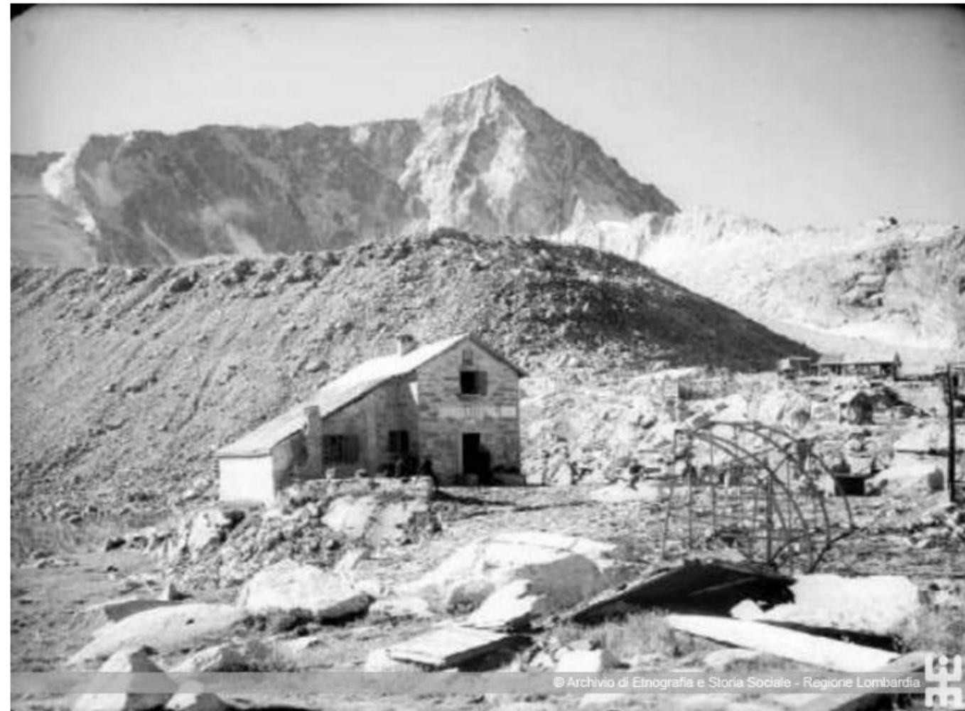
Gruppo dell'Adamello. Rifugio Garibaldi