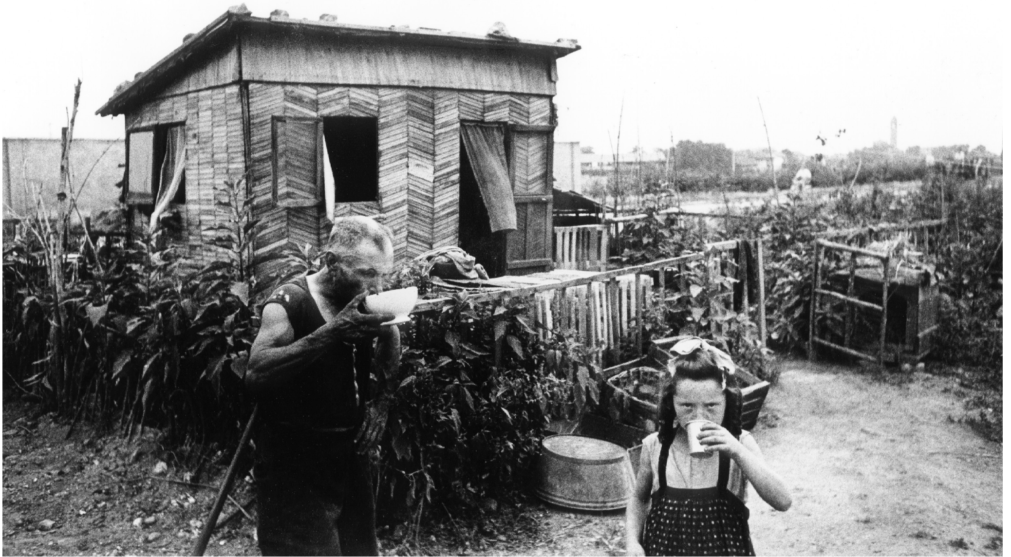
Baracche. Una bambina ed un vecchio bevono all'esterno di una baracca.