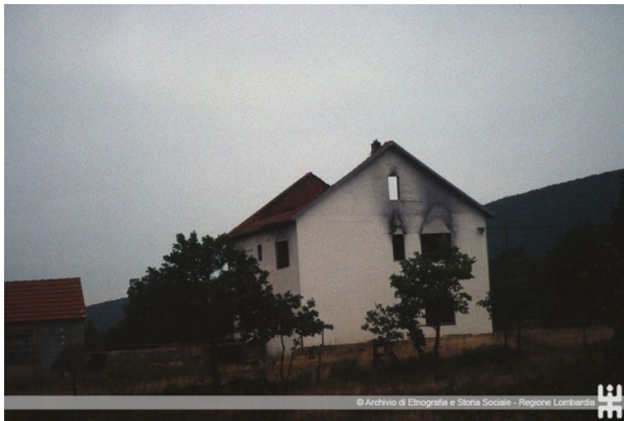
Abitazione danneggiata durante la guerra dei Balcani ITE-OPD00-0000091797

per arrivare al progetto finale, ho utilizzato l'archivio per trovare foto di palazzi distrutti o danneggiati dalle guerre.