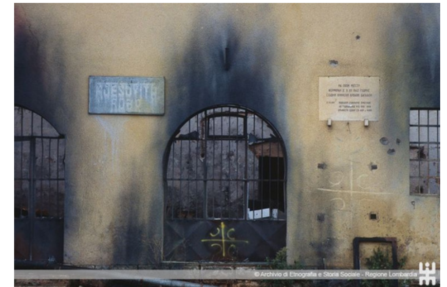
Edificio danneggiato durante la guerra dei Balcani ITE-OPD00-0000091799