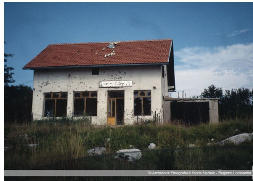
Edificio danneggiato durante la guerra dei Balcani ITE-OPD00-0000091803